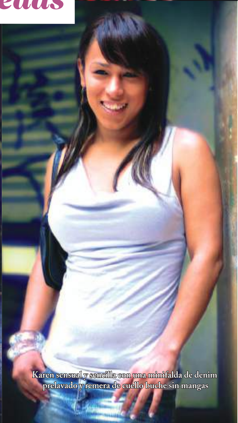
Karen sensual y sencilla con una minifalda de denim prelavado y remera de cuello buche sin mangas