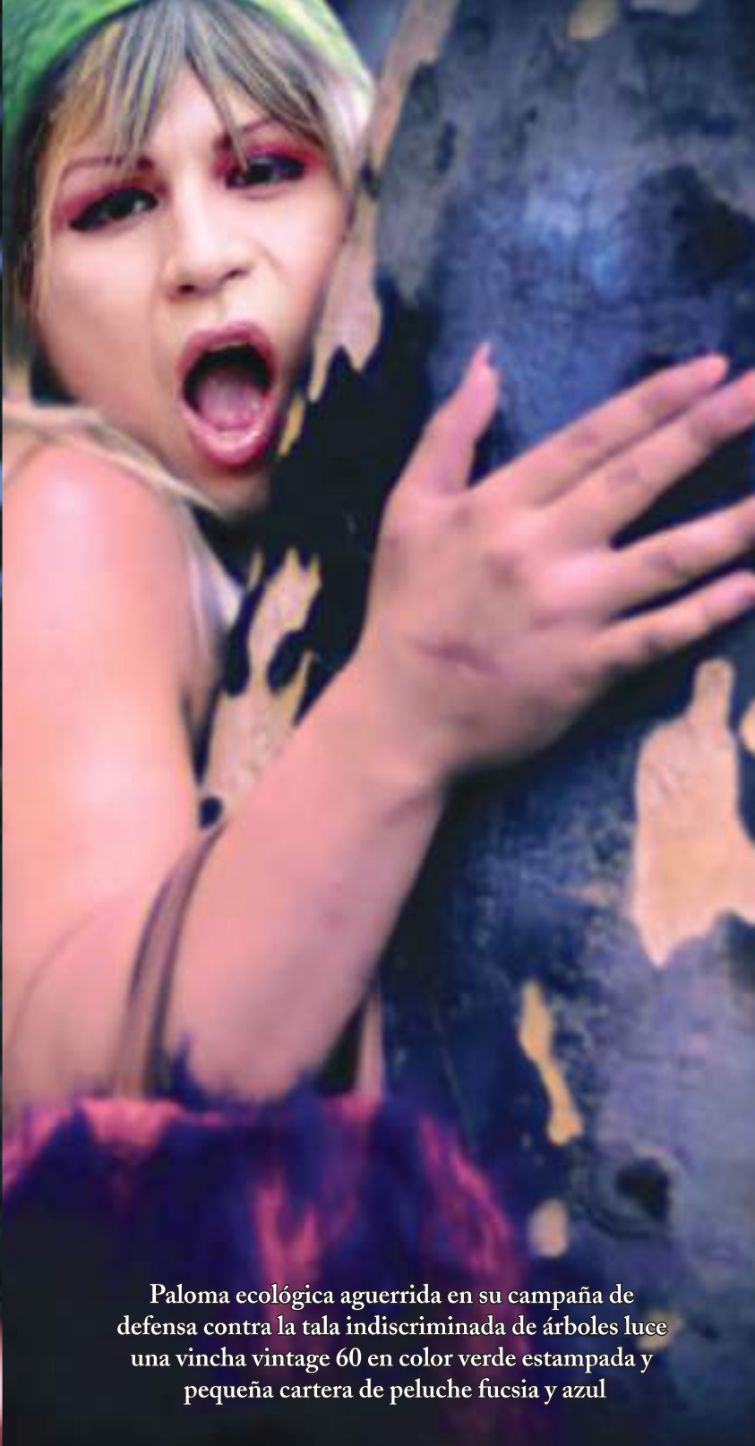
Paloma ecológica aguerrida en su campaña de defensa contra la tala indiscriminada de árboles luce una vincha vintage 60 en color verde estampada y pequeña cartera de peluche fucsia y azul